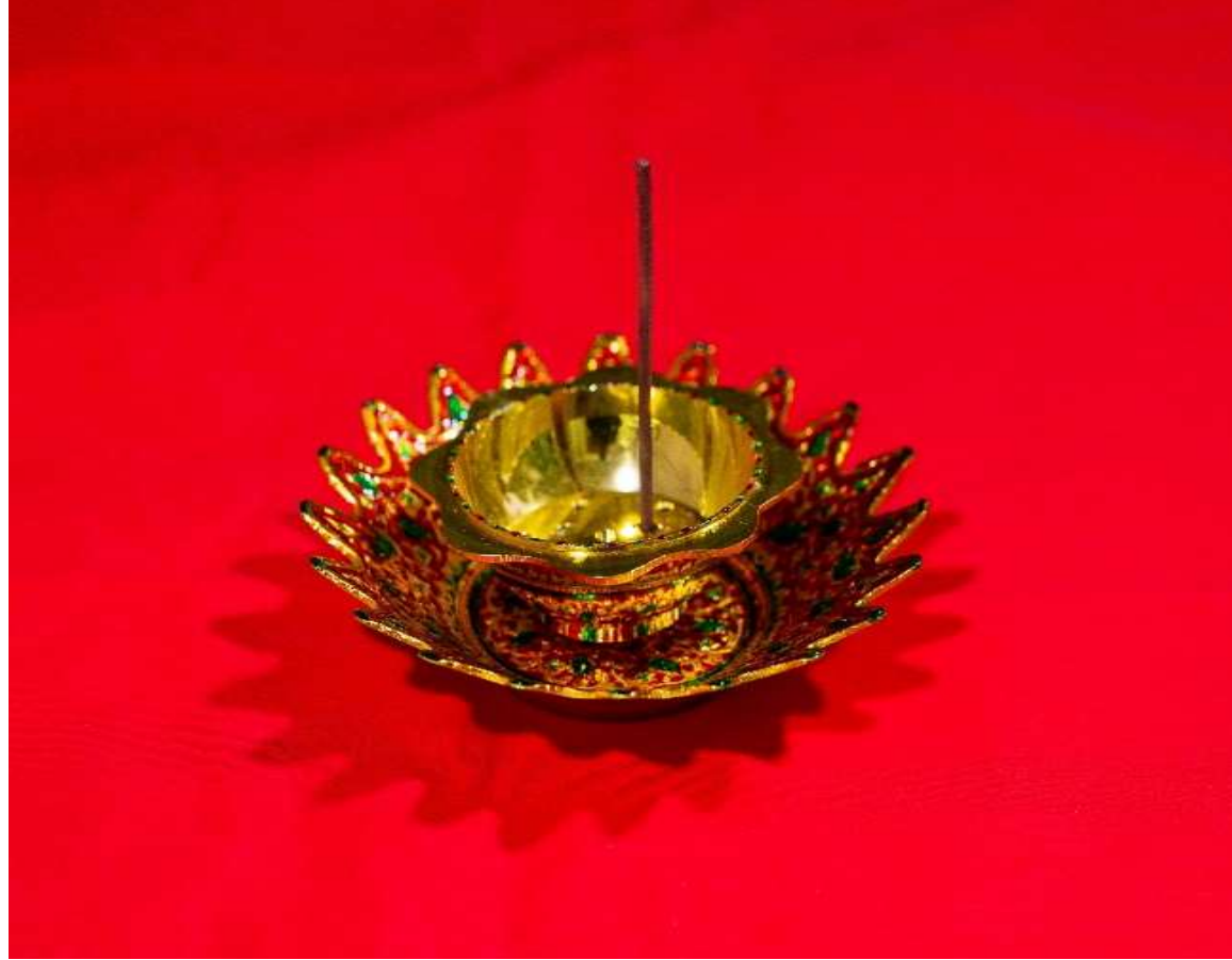
ધૂપિયું – Dhooپیયુ