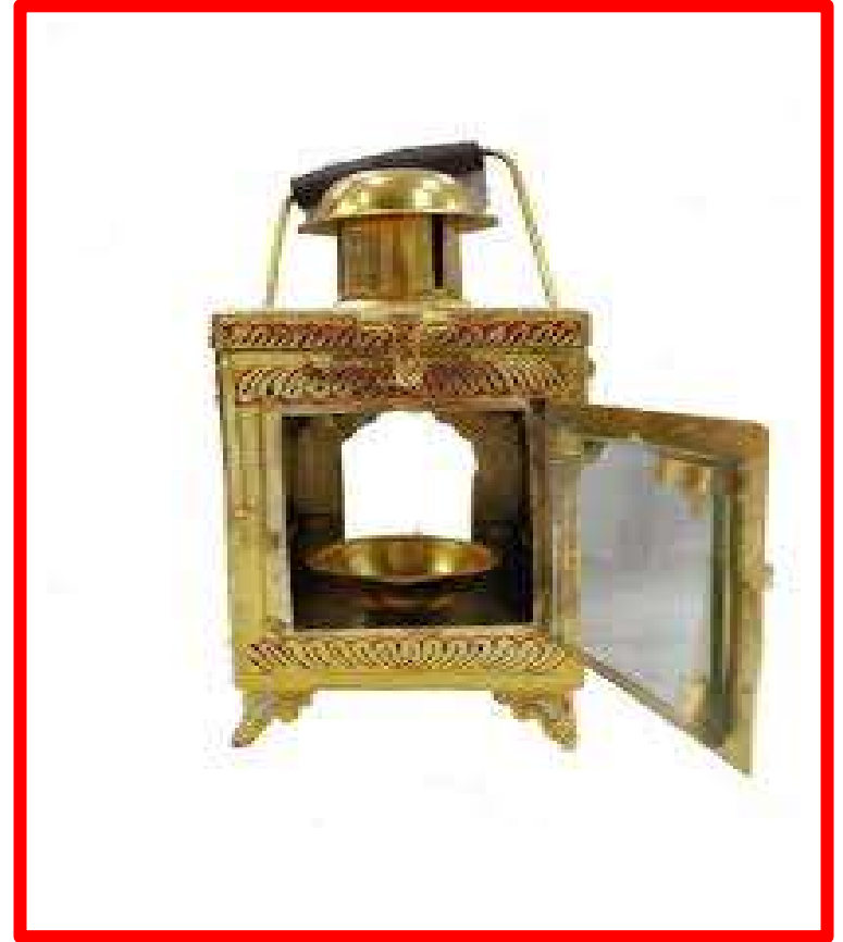
દીપક - Deepak