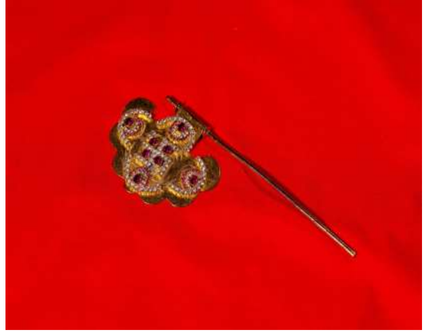
પંખો - Pankho