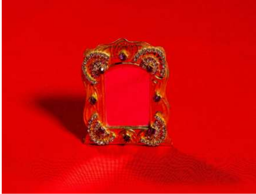
દર્પણ - Darpan