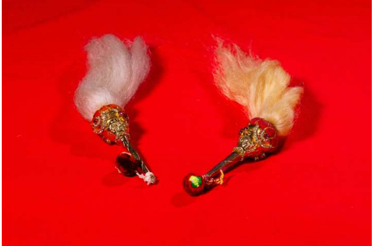
ચામર - Chaamar